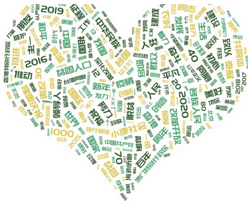
Рис. 3. Карта облака слов текста новогодних обращений Си Цзиньпина 2014–2022 гг.